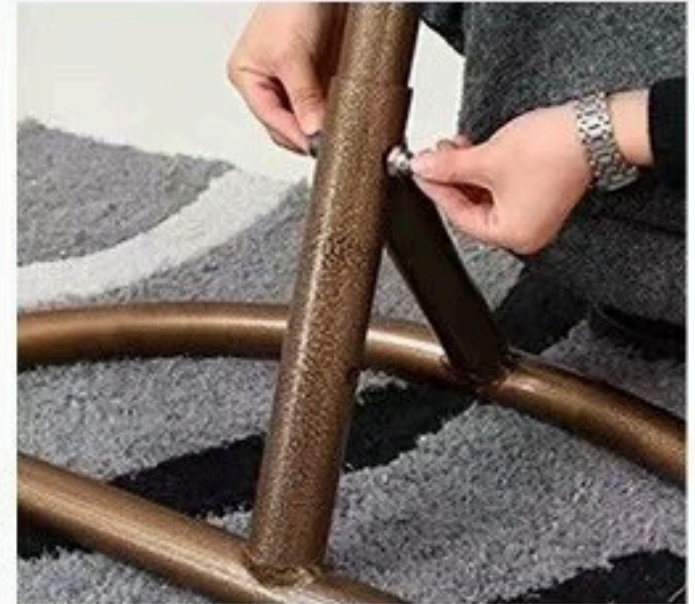
3. PORAVNAJTE SA RUPAMA I PRIČVRSTITE ŠARAFE.