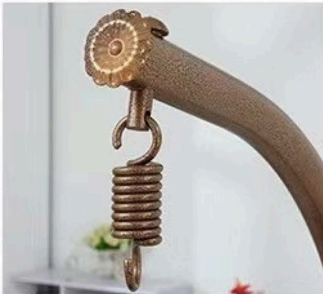
5. POSTAVITE OPRUGU (MEHANIZAM ZA VJEŠANJE) I ZAKAČITE KUKU.