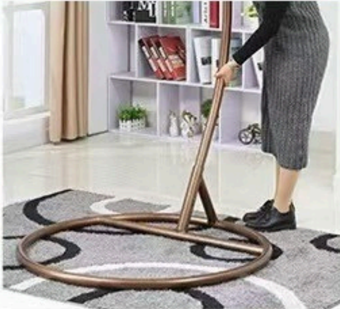
2. UMETNITE ŠIPKU (STUB) U BAZU I PORAVNAJTE JE SA RUPOM.