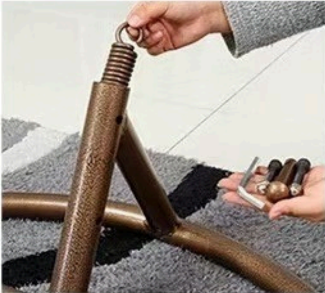
1. IZ BAZE (POSTOLJA) IZVADITE DIJELOVE POTREBNE ZA MONTAŽU.