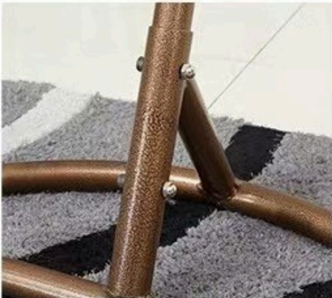
4. KORISTITE KLJUČ DA PRITEGNETE ŠARAFE.