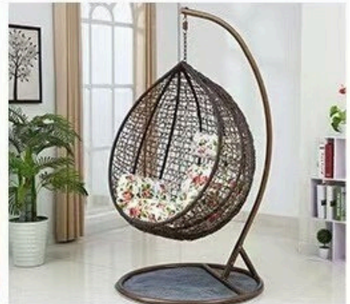
6. ZAKAČITE KORPU (STOLICU) I GOTOVO. VRLO JE JEDNOSTAVNO.